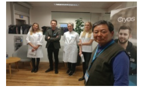
The Cryos International 본사 방문 2019.05.02