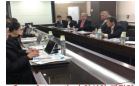
Cryos International 아시아 태평양 허브 설립을 위한 Press Meeting 2019.03.23