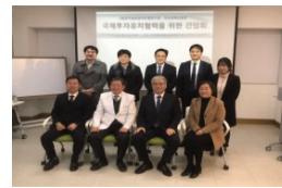
국제투자유치 협력을위한간담회 2019.02.19