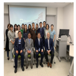
International Special Lecture 2019.05.13