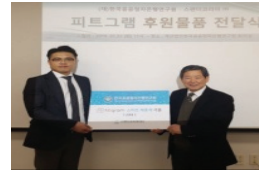
스펀더스 체중계 기증식 2019.01.22