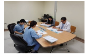
정자기증 프로세스 내부감사 2019.06.04