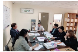
연구용역 자문회의 2019.05.09