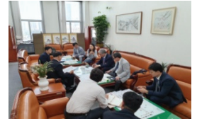
국회 이명수 보건복지위원장 면담 2019.06.05