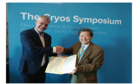
KoIPSB-Cryos Int' MOU체결 2019.05.03