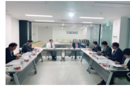
"생식세포에 관한 법률" 제정을 위한 전문가 자문회의 2019.05.14