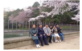
제4회 한국공공정자은행연구원 봄 소풍 (벚꽃 나들이) 2019.03.29