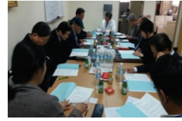
제8차 한국공공정자은행연구원 정기이사회 2019.03.26