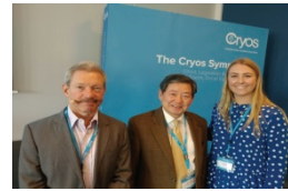
2019 Cryos Symposium 참가 2019.05.02