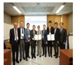
The 2 nd International Conference for Sperm Bank 2019.06.01